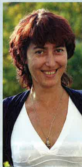
Carmen kijkt in de toekomst

De tarot-fans mogen ook graag Carl Gustav Jung (1875-1961) aanhalen, de befaamde Zwitserse psychiater die het begrip 'synchroniteit' ontwikkelde. Het gaat hier om het samenvallen van twee gebeurtenissen in tijd en ruimte die op een meer dan toevallige wijze met elkaar verbonden zijn. Het schudden van de kaarten en de wijze waarop die kaarten komen te liggen, zouden een voorbeeld van zo'n zinvolle samenhang zijn.